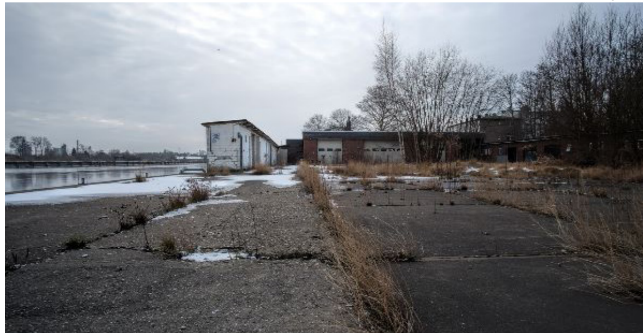
[16] Jade-Bad: Gelände