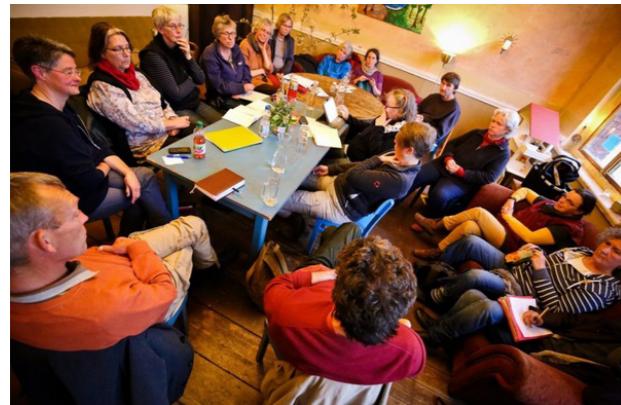
[15] Hitzacker Dorf: Genossenschaft

Solidarisch wollen arme, reiche, geflüchtete, junge und alte Menschen zusammen ein neues Dorf gründen und bewohnen. Ziel des Dorfs ist es anders zu sein und Menschen aus verschiedenen Lebenslagen ein Zuhause zu bieten. Dieses Projekt soll das Leben im Dorf attraktiv machen und dem „Dörfersterben“ entgegenstehen. Die zukünftigen Bewohner organisieren sich als Baugenossenschaft mit einem Verein und einer Bau-GmbH. Um geringe Mieten zu gewährleisten, sollen einfache Häuser als genossenschaftliches Eigentum gebaut werden.