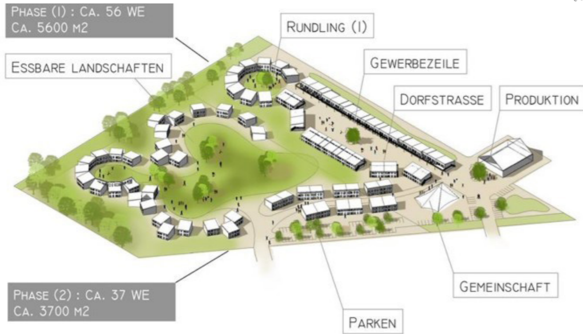
[13] Hitzacker Dorf: Konzept | © Manfred Rebenstich