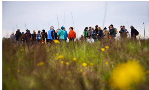
[14] Hitzacker Dorf: Standort