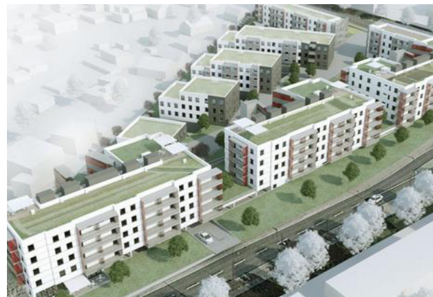
[104] TOM: Übersicht | © tafkaoo architects gmbh