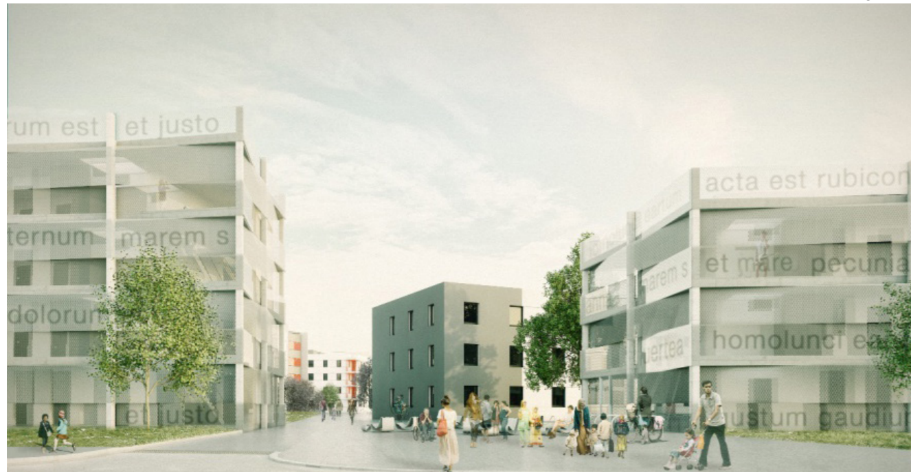
[103] TOM: Außenansicht | © tafkaoo architects gmbh