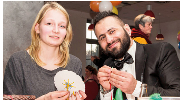
[105] TOM: Veranstaltung | © tafkaoo architects gmbh

Das ToM ist ein Neubauprojekt von 166 Wohnungen, die zur Hälfte von geflüchteten Menschen bewohnt werden. In der Planungsphase des Wohnprojekts wurden Workshops mit geflüchteten Menschen und eine Versammlung für Anwohner*innen organisiert. Ergebnis dieses Workshops war die Variation an Wohnungsgrößen zwischen 1-4-Zimmerwohnungen. In Zusammenarbeit mit dem Internationalen Bund (IB Berlin Brandenburg gGmbH) wurden eine Sozialberatung, ein Mieterbeirat, ein Anwohnercafé, eine interkulturelle Kita und andere Funktionen mitgeplant.