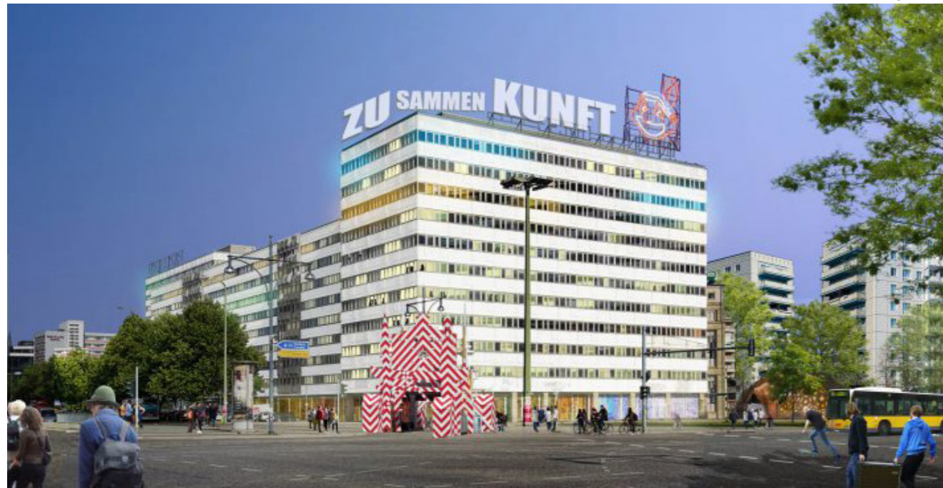
[97] Zusammenkunft: Außenansicht | © raumlabor berlin