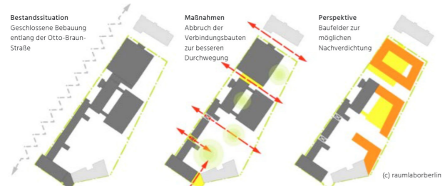
[99] Zusammenkunft: architektonisches Konzept | © raumlabor berlin

Das Haus der Statistik am Alexanderplatz wird von der Idee getragen die gemeinsame Alltagskultur von Künstler*innen, Initiativen, geflüchteten Neu-Berliner*innen und Alt-Berliner*innen zu fördern. Das Projekt steht als Modell eine Koalition aus verschiedenen Gruppen zu testen, das auch auf andere Gebäude übertragen werden kann. Durch eine besondere Mischnutzung gibt es Angebote für geflüchtete Menschen, Künstler*innen und andere Bewohner*innen sich weiterzubilden und auszutauschen. Veranstaltungen und Workshops mit geflüchteten Menschen finden schon in dem Gebäude statt.