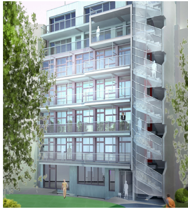
[93] Lebensort der Vielfalt: Fassade zum Hof | © Christoph Wagner Architekten