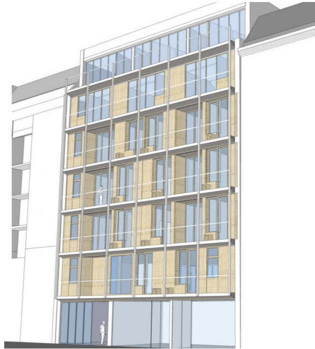
[94] Lebensort der Vielfalt: Fassade zur Straße | © Christoph Wagner Architekten