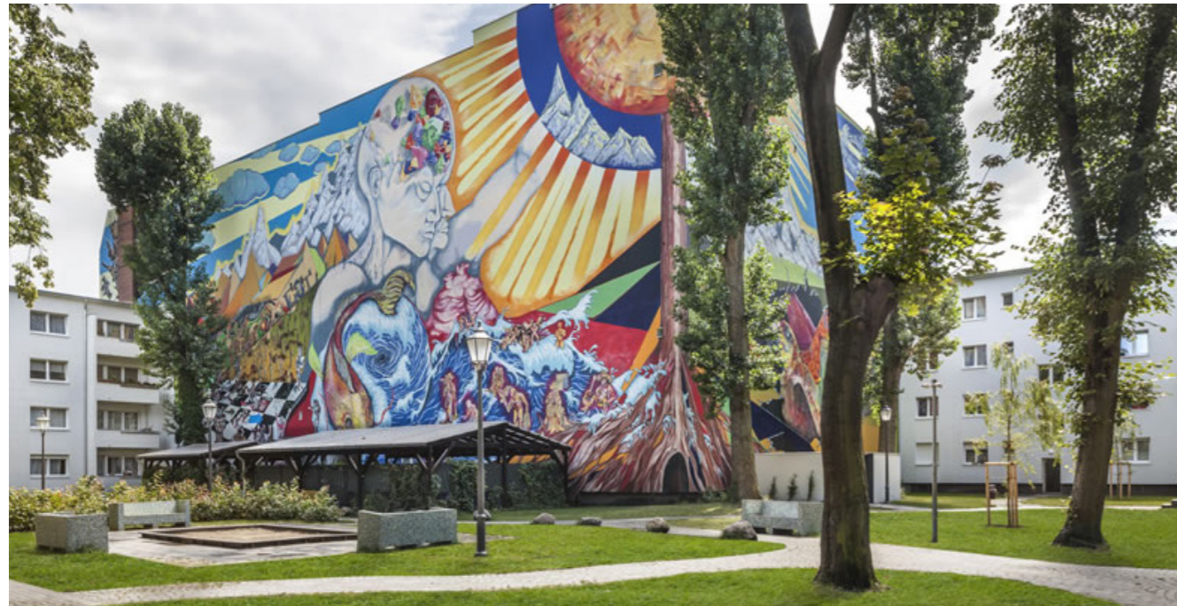
[90] Projekt Harzer Straße: Kunstprojekt