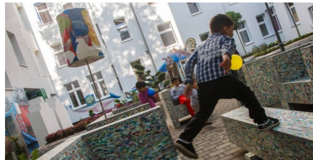
[91] Projekt Harzer Straße: Spielanlagen