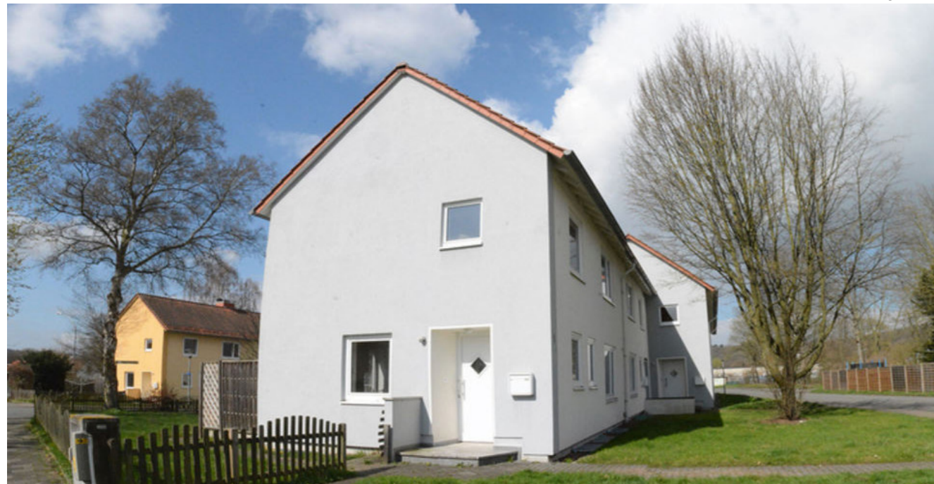
[7] Englisches Viertel. Wohnhaus