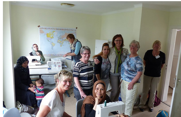
[9] Englisches Viertel. Nähtreff

Stadt und Landkreis wollen mit diesem Projekt einerseits Leerstände aktivieren und andererseits für Zuwanderer Wohnraum schaffen. Als Modellprojekt sollen hier verschiedene Sozialgruppen unterschiedlicher Herkunft, Alter und Religion zusammenwohnen und das Umfeld mitgestalten. Durch die Nähe zu Schule und Kindergarten ist das Gebiet attraktiv für Familien. Gemeinschaftsräume und viele regelmäßige Veranstaltungen sollen Begegnungen und Austausch zwischen den Bewohnern ermöglichen. Das Projekt wird von der Ikea-Stiftung und der Niedersächsische Lotto-Sport-Stiftung gefördert.