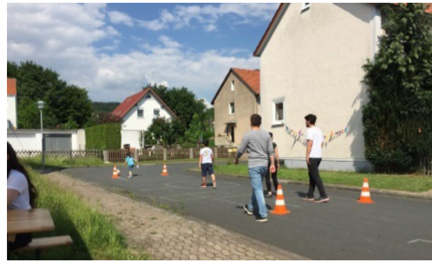
[8] Englisches Viertel. Straßenfest