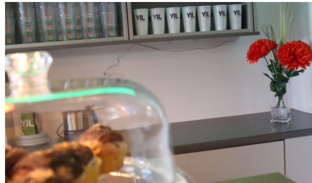
[76] YIL: Café