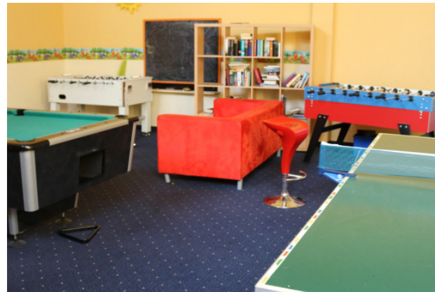
[77] YIL: Freizeitraum

Dieses Wohnprojekt ist Teil eines Studentenwohnheim im Münchner Osten. YIL ist eine sozialpädagogisch begleitete Wohnform für junge Menschen zwischen 18 und 25 Jahren. Neben Wohnraum, werden Bewohner*innen bei der Ausbildung, beim Studium, oder bei der Eingliederung in die Arbeitswelt und der sozialen Integration unterstützt. Zielgruppen sind junge Menschen mit und ohne Fluchthintergrund. Das Wohnheim bietet verschiedene Begegnungsräume wie einen Freizeit- und Fitnessraum oder ein Café.