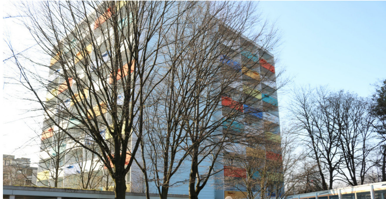
[75] YIL: Außenansicht