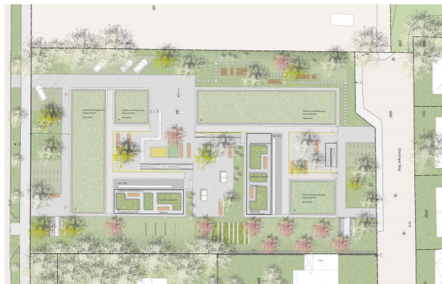
[67] Bodenseestraße – Wohnen für alle: Landschaftsarchitektur