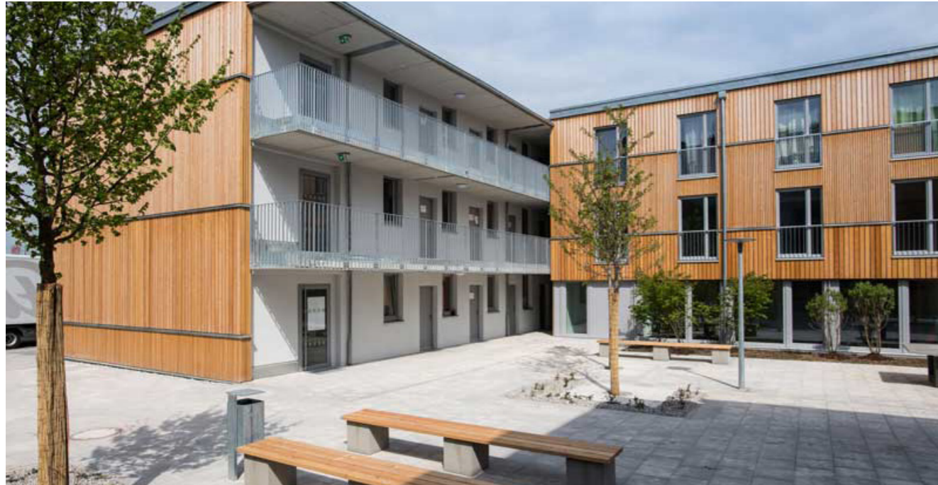
[66] Bodenseestraße – Wohnen für alle: Außenansicht