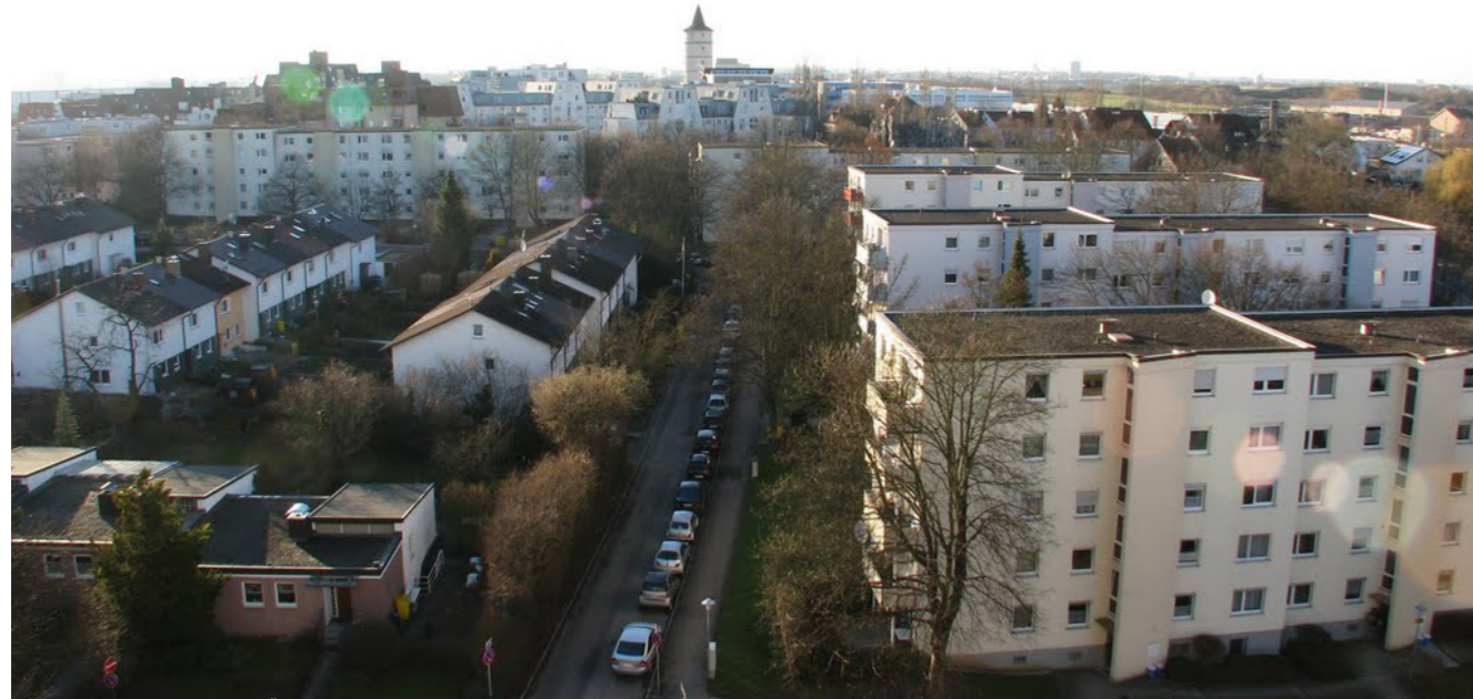
[60] Friedrich-Schofer-Siedlung: Überblick