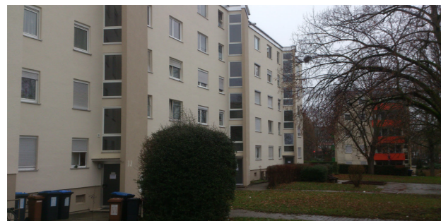
[62] Friedrich-Schofer-Siedlung: Außenansicht

Die Gebäude aus den 1960er Jahren wurden als geförderter Wohnungsbau realisiert. Heute ist dieser Ort ein multiethnischer „Ankunftsort“ für Menschen mit Migrationshintergrund. Dieses Projekt wurde nicht speziell als integratives Wohnprojekt entworfen, sondern die Bewohner haben es zu einem solchen Ort geformt. Das interkulturelle Miteinander entsteht durch das Engagement der Bewohnerschaft Nachbarn kennenzulernen und daraus entwickelte sich „Alltagsort der Migration“. Die begrünten Abstandflächen zwischen den Gebäuden dürfen zum Spielen von Kindern genutzt werden. (Ulrich Dilger)