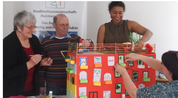
[5] Das vertikale Dorf: Partizipationsworkshop