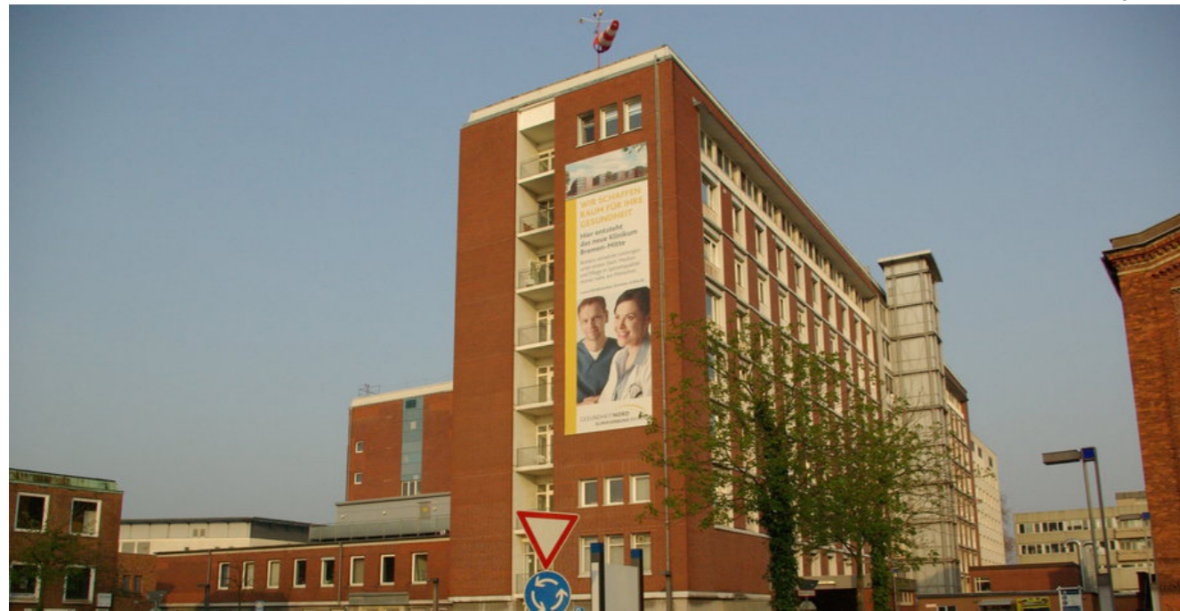
[4] Das vertikale Dorf: Außenansicht Bettenhaus Bremen | © Peter Bargfrede/Stadteilgenossenschaft Hulsberg eG