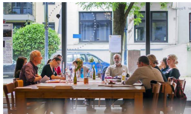
[6] Das vertikale Dorf: Treffen der Genossenschaft

Bewohnerstruktur Neuzugewanderte, Senioren & Seniorinnen, Pflegebedürftige, Menschen mit Behinderung