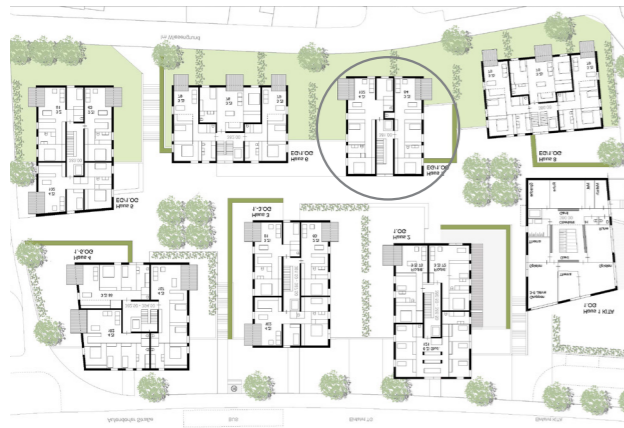
[55] St. Vinzenz-Palotti: Grundrisse Erdgeschoss | © Schwarz.Jacobi Architekten PartGmbH