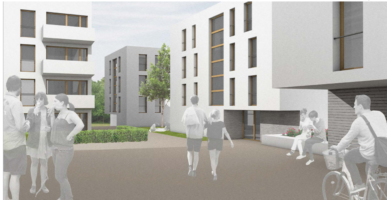
[54] St. Vinzenz-Palotti: Perspektive | © Schwarz.Jacobi Architekten PartGmbH