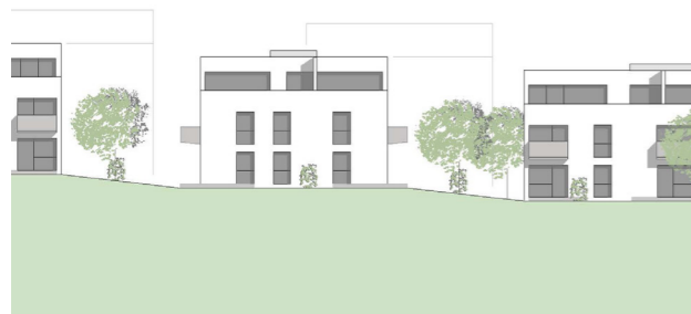
[56] St. Vinzenz-Palotti: Ansicht | © Schwarz.Jacobi Architekten PartGmbH

Das Quartier bietet geflüchteten Menschen, Studierenden und Familien Wohnraum in Sozialwohnungen und Wohngruppen. Die städtebauliche Anordnung der Gebäude soll eine Belebung des nachbarschaftlichen Miteinanders und Inklusion bewirken. Das Palottihaus (kath. Orden) ist als Wohnhaus und nicht als Wohnheim konzipiert. 74 Menschen können in Wohngruppen (1. bis 3. Obergeschoss) und Sozialwohnungen (4. und Dachgeschoss) wohnen. Bei Bedarf können diese Wohnungen in reguläre Wohnungen umgebaut werden.