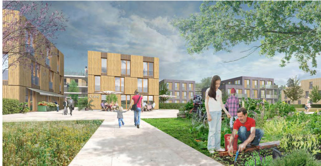
[34] Stadtbaukasten: Perspektive | © florian krieger – architektur und städtebau gmbh