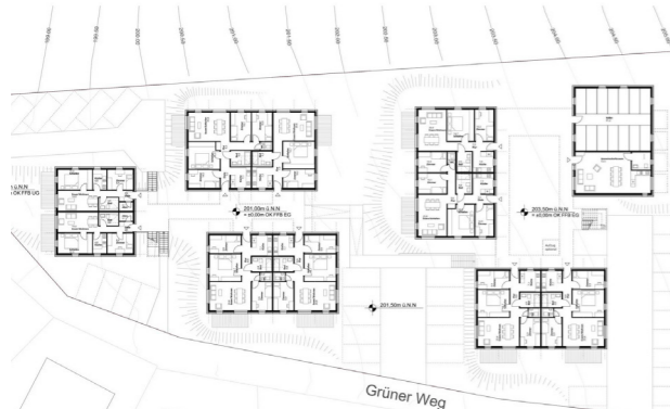
[35] Stadtbaukasten: Grundriss | © florian krieger – architektur und städtebau gmbh