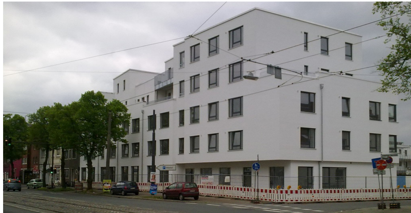
[1] Bunte Berse: Außenansicht