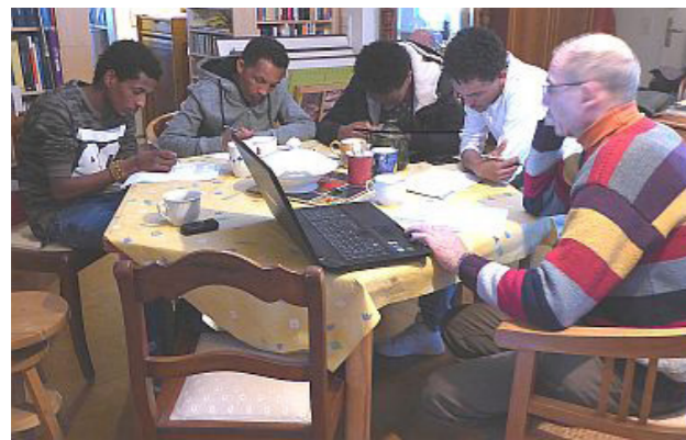
[3] Bunte Berse: Sprachcafé

Der Verein „Bunte Berse – Komşu (türk.= Nachbar) e. V.“ steht für genossenschaftliches Bauen und Leben. 2015 erbaute der Verein ein Gebäude, das zum Teil vermietet wird, zum Teil genossenschaftlich genutzt wird und in dem ein Übergangwohnheim für geflüchtete Menschen integriert ist. Der Verein bietet Freizeitaktivitäten, wie Sprachkurse oder Kurse in der Holzwerkstatt (Möbelbau, Reparaturen) in einem benachbarten Gebäude für die geflüchteten Menschen an. Außerdem gibt es eine Kooperation zwischen dem Verein und einem Kinderatelier.